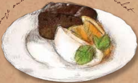
Orange and Cinnamon Gateau Chocolat